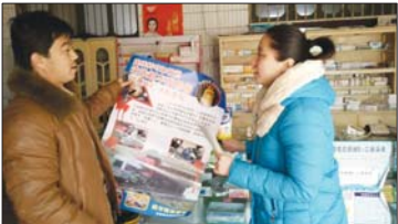
冠县交警进村宣传。

本报聊城1月11日讯(记者 李怀磊 通讯员 高飞鹏 赵晓庆) 为最大限度地预防和减少道路交通事故的发生,加强辖区村民安全防范意识,近日,冠县交警大队联合烟庄街道办事处及开发区法律顾问到农村开展道路交通安全知识宣传活动。