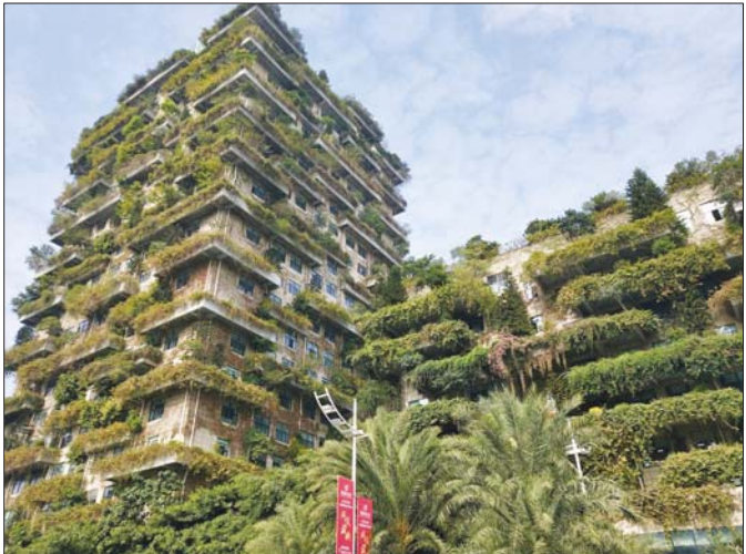
将绿色生态系统与建筑物完美组合。