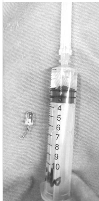
发光二极管与针管的大小比较。

第二,教育儿童不要口中含物玩耍,如发现,应婉言劝说,使其吐出,不能用手指强行掏取,以免引起哭闹吸入气道。第三,进食不宜过快,尤其吃带骨刺类食物时,不宜饭菜同口而咽,要细咀嚼将骨刺吐出,以防误咽。进食时不要嬉笑、哭闹、打骂,以免深吸气时将异物吸入气道。婴幼儿最好在家长的照看下进食。第四,一旦发现有异物吸入的情况,要及早就医。