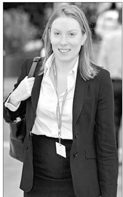
英国首任孤独问题大臣特蕾西·克劳奇

能够将遗愿变为现实,考克斯的丈夫在社交媒体“推特”上发文说,如果妻子还活着,一定会非常开心。他还说,他会告诉自己的两个孩子,虽然他们的妈妈已不在人世,但她“仍在让这个世界变得更好”。首任孤独问题大臣克劳奇说,她将“与‘孤独委员会’、企业、慈善机构等合作,商定一项政府性战略。他们会成立新的基金会,进入社区帮助鉴定那些需要帮助的孤独的人。”