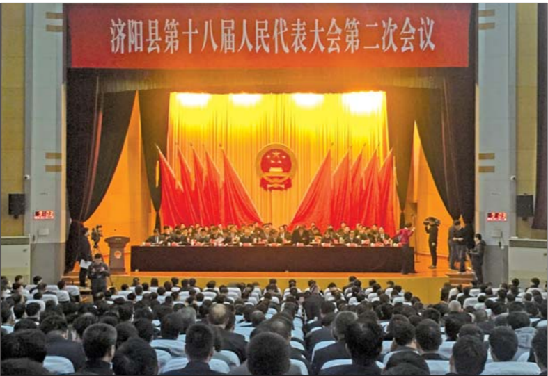
济阳县第十八届人民代表大会第二次会议开幕式。