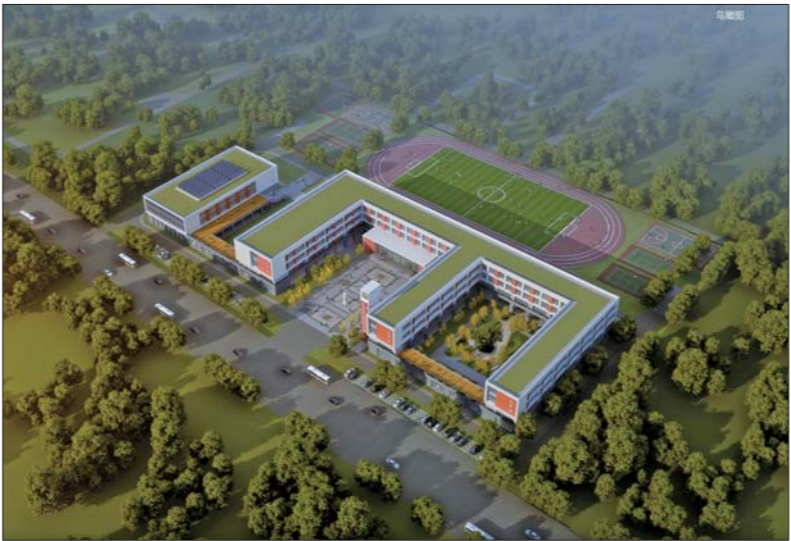
永康街小学效果图。