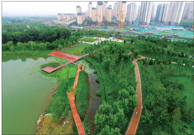
济南华山湿地公园。(资料片)