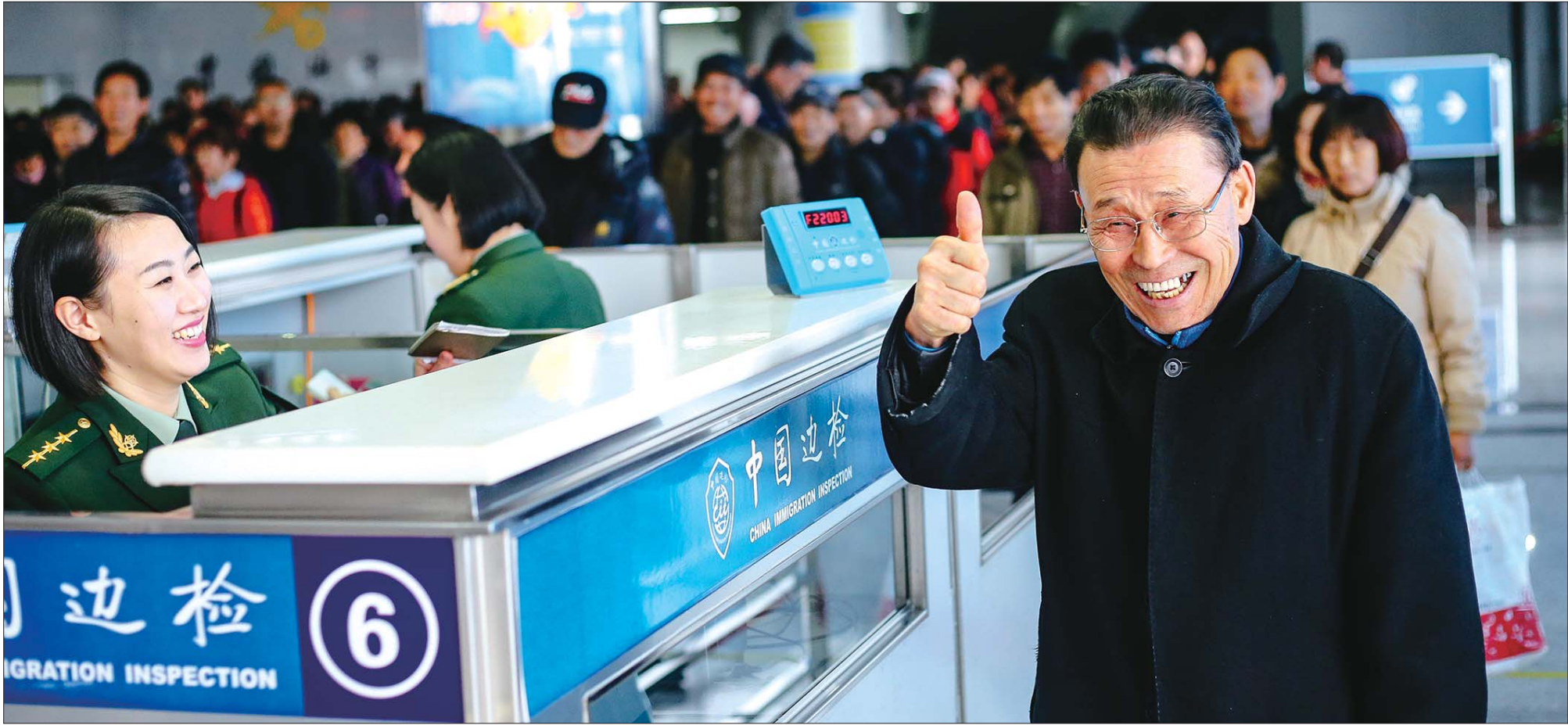
▲一位入境旅客由衷地点赞:中国边检,好样的!