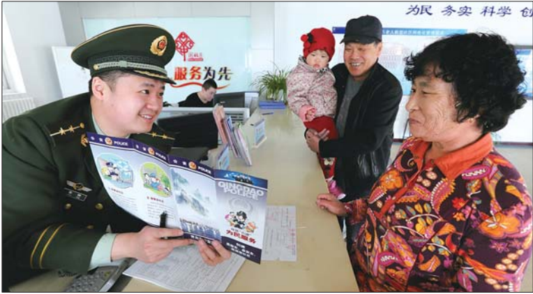
青岛边防民警向辖区居民宣传法律知识。

曹园媛: 十年前,自强不息的受助女童;十年后,归巢反哺的阳光女警。她心系群众,情洒蓓蕾,筑起爱心联