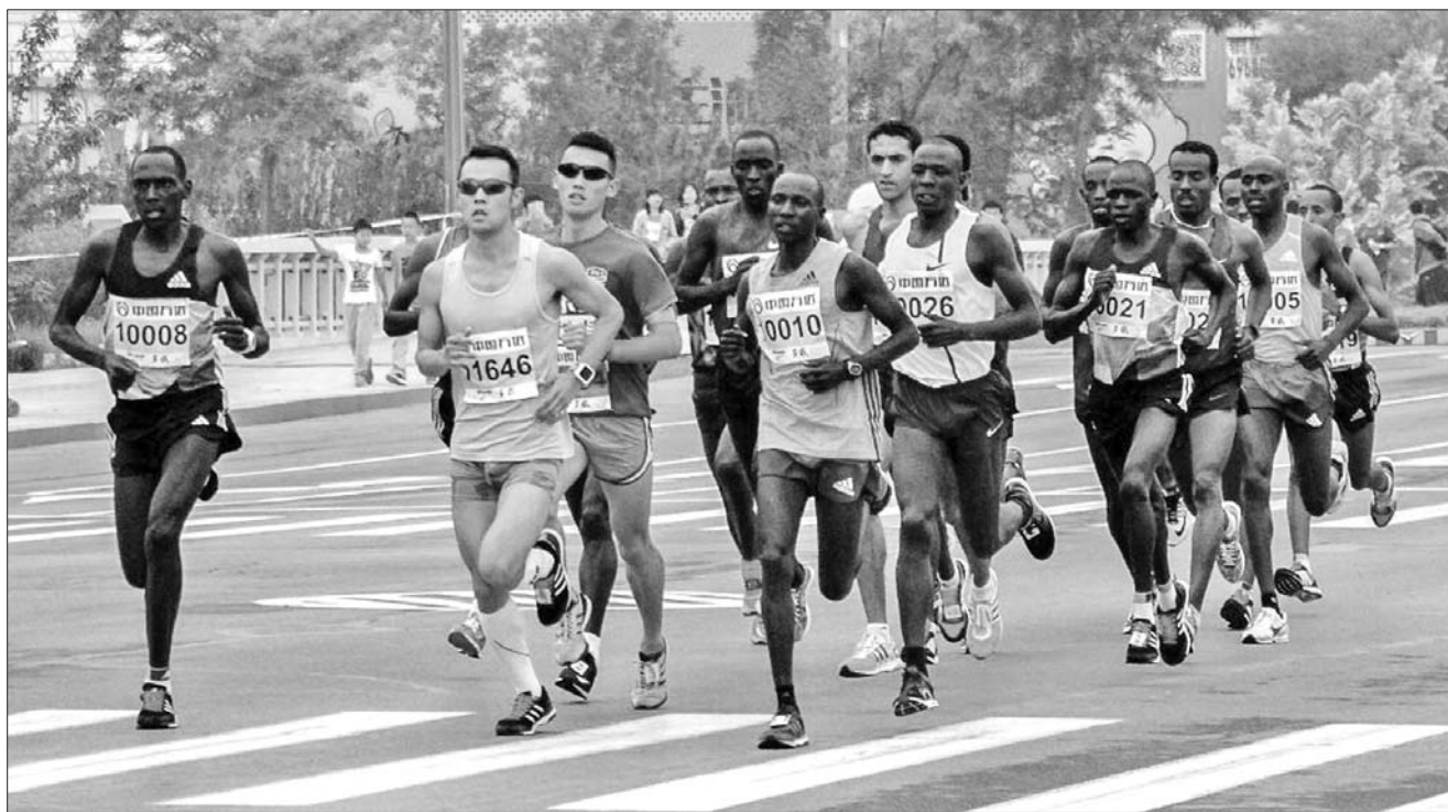
我省体育竞赛表演活动得到了巨大的发展,如火如荼的马拉松赛给体育产业注入新的活力。