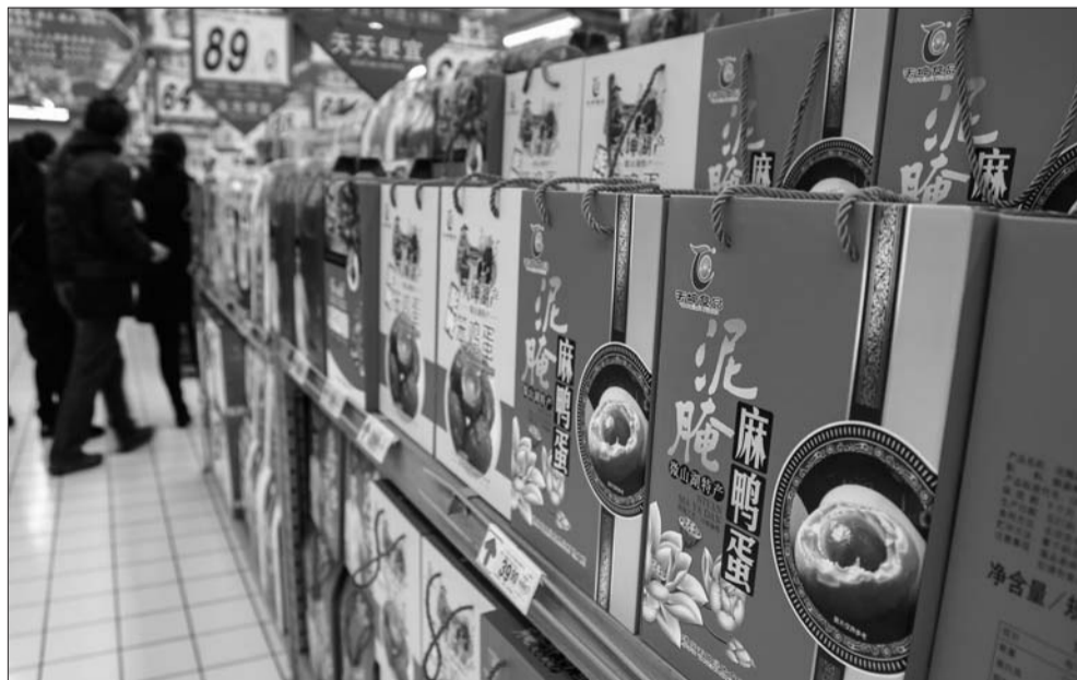
济宁本土特产礼盒摆放在超市显眼位置。

春节临近,城区各大超市“年货饰品”琳琅满目,各类促销活动也层出不穷。日前,记者走访发现今年济宁本土特产颇为畅销,占据年货大街一席之地,个别特产生产企业甚至出现缺货现象。