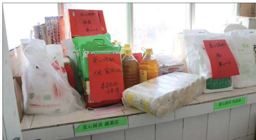
爱心厨房里好心人捐赠的物品摆放在窗台上。