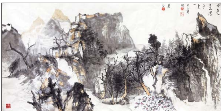
▲山色呈濛 贾荣志 136x68cm