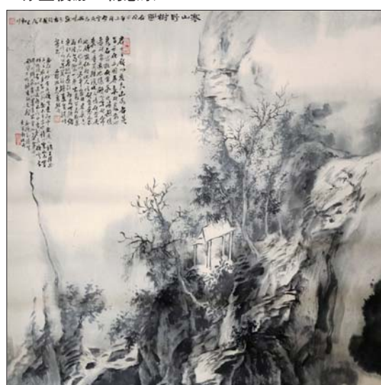
▲寒山野树图 茹峰 68x68cm