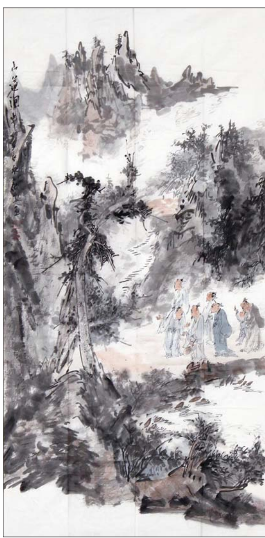
▲山道问步 顾平 136x68cm

这次联展作品充分体现了二人深厚的传统功力和独具匠心的创新意识。齐鲁大地文化传统源远流长,书画名家更是不胜枚举。两位艺术家选择在山东举办展览,旨在向齐鲁同道求教,更是为两地书画交流架设沟通桥梁。