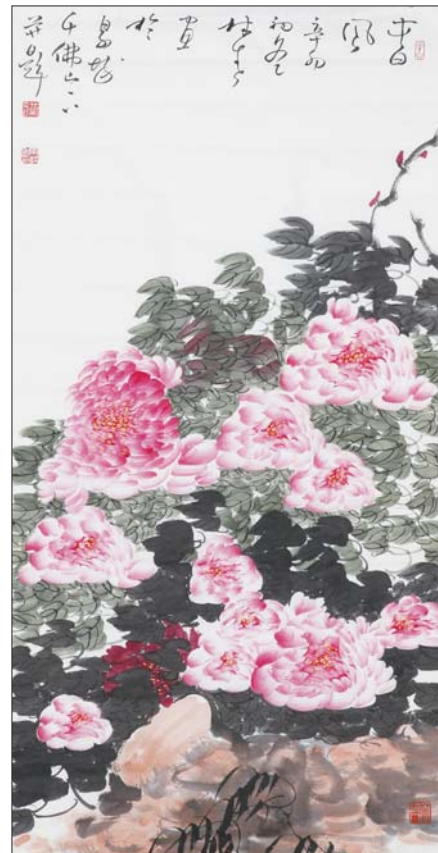
▲春风 马麟春 136x68cm