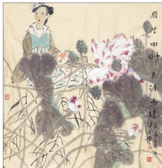
▲雁字回时 梁文博 68x68cm

青未了画廊地址: 济南市马鞍山路2-1号山东大厦大堂 鉴藏热线: 15966685196、15853198656