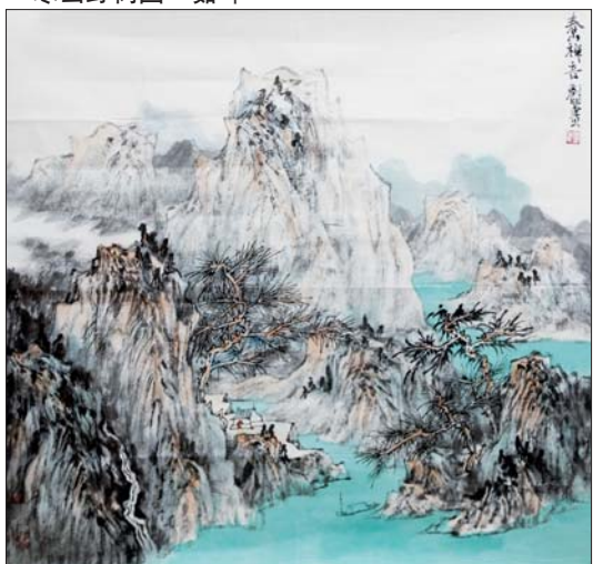
▲春山禅音 刘明 68x68cm