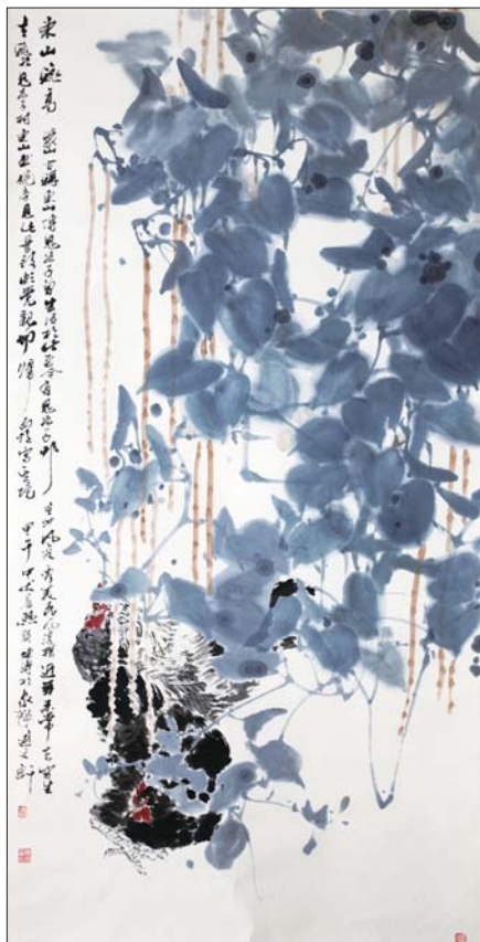
▲花鸟写生 陈涛 136x68cm