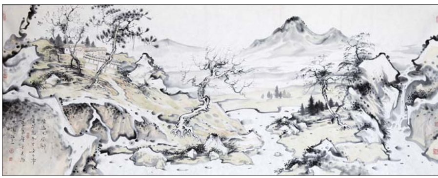
▲清逸山居图 李延智 180x68cm

青未了画廊地址: 济南市马鞍山路2-1号山东大厦大堂 鉴藏热线: 15966685196、15853198656