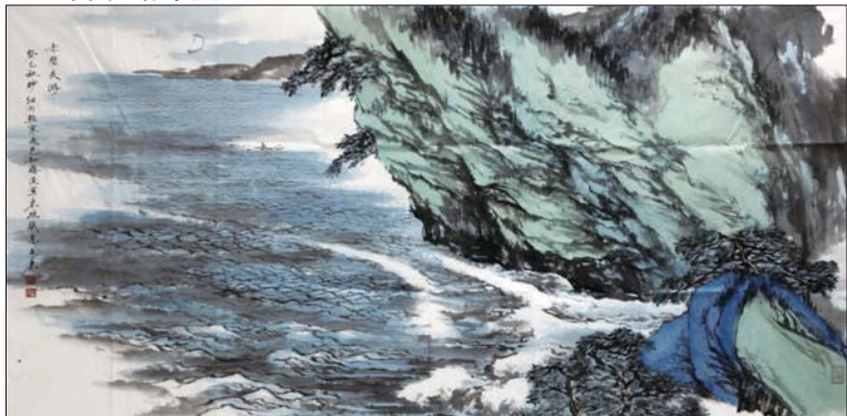
▲赤壁夜游 杨惠东 136x68cm