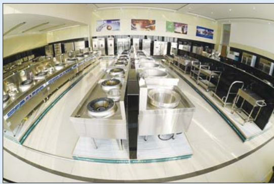
朱台镇厨房设备产品。