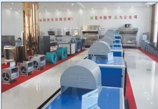
朱台镇环保通风设备产品。

积极参加全国厨具展销会,将朱台品牌进行集中推广。自主开发厨具产业电子商务平台,面向世界开展线上交易。扶持互联网O2O平台,推广建立区域体验中心,面向终端用户直接营销,建立线上、线下多渠道、立体化营销推广体系。与成熟的物流企业进行合作,打造建设现代物流区,将运输、仓储、装卸、加工、整理、配送、信息等方面有机结合、形成完整的供应链,为用户提供多功能、一体化的综合性服务。