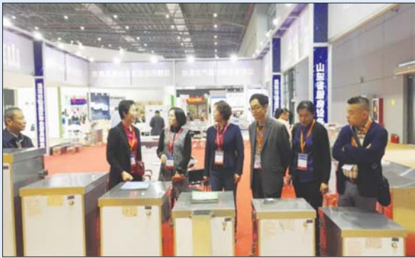
朱台厨具商会组团赴上海参加世界五金大会暨2017年中国国际厨房博览会。