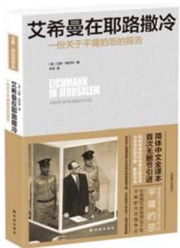
《艾希曼在耶路撒冷》 汉娜·阿伦特 著 译林出版社

死亡之荣誉再心存幻想。对于这场战争中发生的规模空前的残暴和罪行,欧洲各地的民众当然都不陌生。人类何以如此相互残害?最重要的是一个欧洲民族(德国人)何以会试图灭绝另一个欧洲民族(犹太人),他们为何会这样做?在阿伦特这样敏锐的观察者看来,这些问题将不言而喻地成为欧洲摆脱不掉的问题。她所说的“邪恶的问题”就是这样的意思。