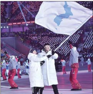
朝韩两国代表团在冬奥会开幕式上携手入场。