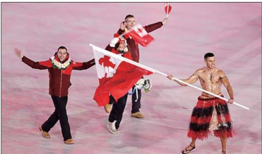
严冬之中，“勇敢”的汤加勇士成为一道风景线。