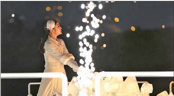
韩国花滑名将金妍儿在开幕式上点燃主火炬。