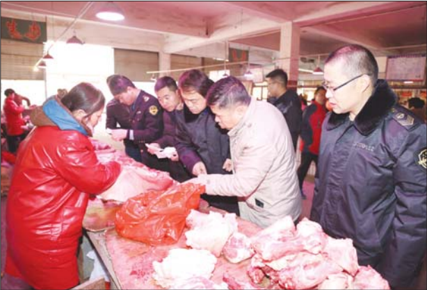
执法人员在农贸市场对肉类进行检查。

理使用等相关情况,严厉查处年夜饭餐饮服务食品安全违法行为。 执法人员在人流量大、消费密集的市场超市开展快速检测活动,主要针对超市蔬菜等食用农产品的农药残留问题进行检测。在活动期间,药监部门组织经验丰富的监管执法人员和技术熟练的检测人员,严格按照快检程序对超市经营的蔬菜进行抽样和检测,并对消费者送检的蔬菜进行现场检测,并将检测结果进行现场公示。 重点对消费人群相对集中区域和食品交易集中区域进行专项检查,针对城乡食品生产经营集中区(含小作坊生产聚集区)、旅游景区、城乡结合部、农村地区、庙会灯会、高速公路服务区等,重点监管酒类、肉