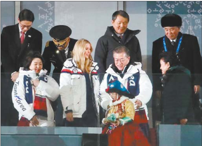
2月25日,在平昌冬奥闭幕式上,特朗普的长女伊万卡(前排左二)和朝鲜战部长金英哲(后排右一)同时起身问候准备入座的文在寅(前排左三)。