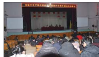
严禁在职教师有偿补课 放假前,沂源县实验中学全体教职工召开会议,着重强调“严禁在职教师假期有偿补课”,重拳出击有偿补课。(张善武)