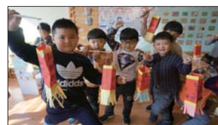
做灯笼,欢喜过佳节 为让孩子感受我国传统节日的气氛,传承传统文化,淄川区实验幼儿园春节前夕组织了“巧手做灯笼,欢喜过佳节”活动。(马永群)