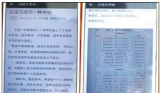
构建书香寒假 沂源三中进一步加强对学生的寒假生活的指导,积极组织学生开展假期读书活动。根据学生年龄特点向学生推荐部分优秀图书。(江秀德)