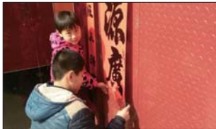
春节传统节日教育 为营造春节祥和氛围,让学生感受传统节日的文化魅力,春节期间,沂源县鲁村中学开展了春节传统节日教育活动。(唐传成)