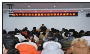
整治有偿家教 近期,桓台县起凤中学通过完善体制、师德教育、专项整治等方式,确保寒假期间制止有偿家教工作真正落实到位。(张久伟)