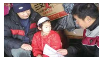
寒假家访活动 沂源县鲁村镇草埠中心完小重视家访工作,寒假期间,组织全体教师开展了家访活动,实现了学校、老师、家庭“零距离”沟通。(崔现贵)