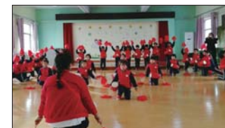
欢乐腰鼓 腰鼓是一个喜气洋洋的表演项目,又是一项趣味十足的健身活动。日前,沂源县鲁山路幼儿园组建了欢乐腰鼓队,培养幼儿的美感。(张宗叶)