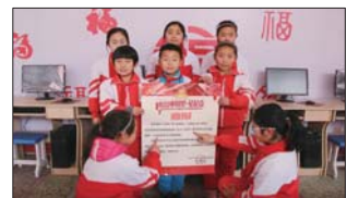
节目上省春晚 沂源县荆山路小学三名学生联合主演的《五十六朵花开》,入选山东电视台2018少儿春晚,进一步促进学生个性能力的培养。(刘成学)

房镇镇中心小学根据学生年龄特点为学生量身定制了小学寒假实践性作业。包括让小学生了解年风年俗,手工制作、书写张贴春联,包饺子、学做菜等,还有倡导强身健体的体育锻炼,制定读书计划等。(张大鹏)