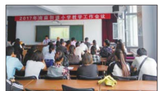
召开教学工作会 近日,沂源县南麻教体办组织召开了小学教学工作会,各学校校长中层干部和教师代表60余人参加了会议。(张德生)