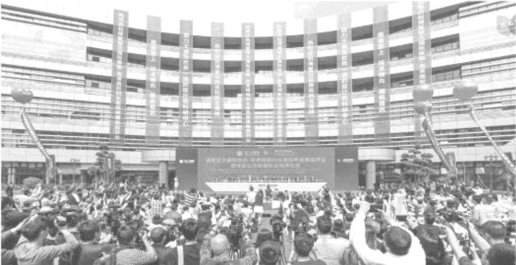
博鳌恒大国际医院开业推杆仪式

中国医疗系统正经历巨大变革,布莱根医院看到了恒大健康为改善和提升医疗服务的愿景和坚持。博鳌恒大国际医院位于乐城国际医疗旅游先行区,具有独一无二的区位和政策优势,中美专家深度合作可为患者带来最前沿疗法。 资料显示,博鳌乐城国际医疗旅游先行区由国务院正式批准设立,是中国首个以国际医疗旅游服务、生态社区和国际组织聚集地为主要内容的国家级开发园区。同时,先行区获得包括享有国外医疗器械和药品进口特殊审批、境外医师执业时间放宽等国家九项特殊优惠政策支持,使世界前沿的新技术、新药物、新设备在此得到最好应用。 凭借先行区政策优势并结合布莱根医院在肿瘤研究领域的杰出成就,博鳌恒大国际医院将打造高标准的临床科研和转化平台,积极与高等