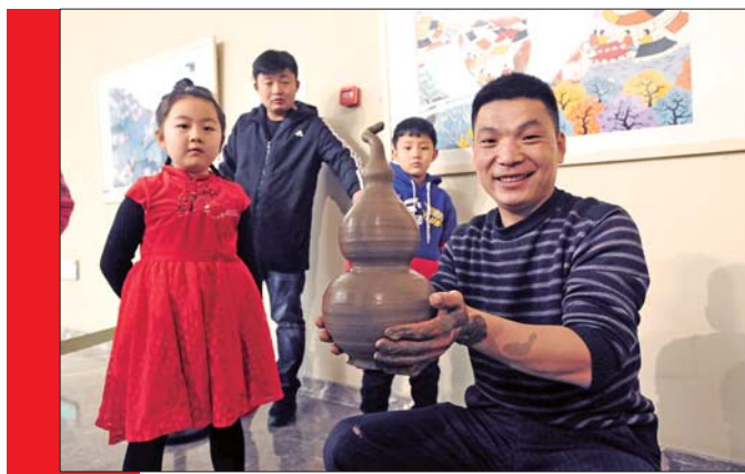
黑陶艺人现场展示拉坯。

开幕式上,山东省文联党组书记、副主席王世农,山东省政协科教文卫体委员会原副主任郝铁柱,省委宣传部文艺处副处长孙梅,山东工艺美术学院院长、省民协副主席董占军,有关领导,省民间文艺家协会主席团成员,济南市文联有关领导、市民协负责人等出席。四位体验基地的民间艺人共同宣布了展览开幕。