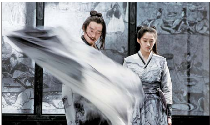
张艺谋的《影》公布海报。

张艺谋执导,邓超、孙俪、郑恺、王千源、胡军等主演的电影《影》,3月1日宣布定档暑期。与以往作品的“浓墨重彩”相比,《影》尽显水墨山水风格。不仅是张艺谋,一大批知名华语片大导演都将在2018年“回归”:姜文、徐克、冯小刚回归自己的优势创作题材;在商业片市场沉寂多年的第六代导演也集体回归,贾樟柯、管虎、娄烨等人的作品令人期待。