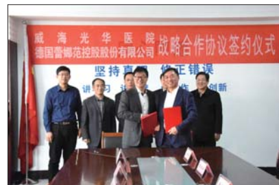
威海光华医院与德国蕾娜范控股股份有限公司签订战略合作协议。

2017年11月16日上午,威海光华医院与德国蕾娜范控股股份有限公司签订战略合作协议,通过此次战略合作,双方将携手建立多领域、全角度的合作,实现优势互补、战略共赢。