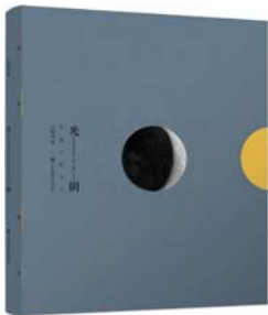
《光阴:中国人的节气》 申赋渔 著 江苏美术出版社