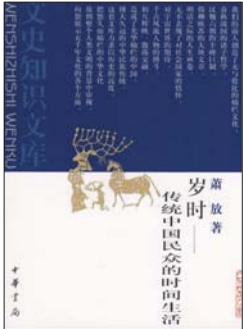
《岁时:传统中国民众的时间生活》 萧放 著 中华书局