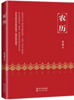
《农历》 郭文斌 著 长江文艺出版社