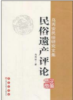
《民俗遗产评论》 乌丙安 著 长春出版社