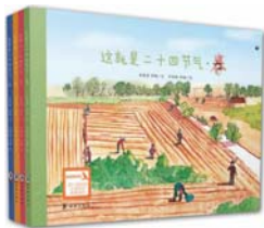
《这就是二十四节气》 高春香 邵敏 著 许明振 李婧 绘 海豚出版社