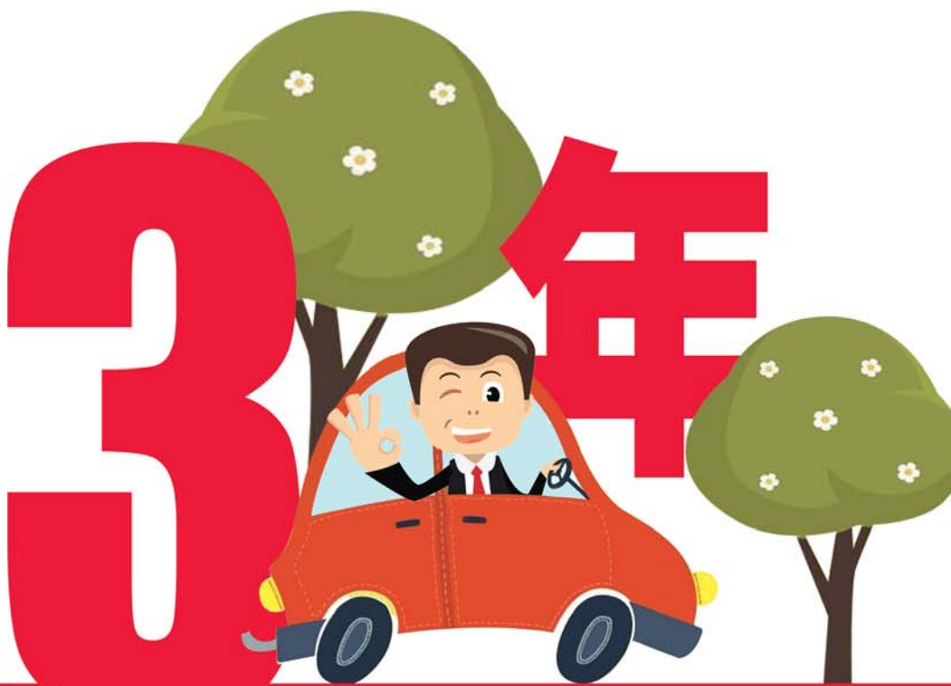
2017年二手车交易量和新车销量

2018年3月6日 星期二 | 齐鲁晚报 | A05 编辑:任志方 美编:马晓迪 组版:继红