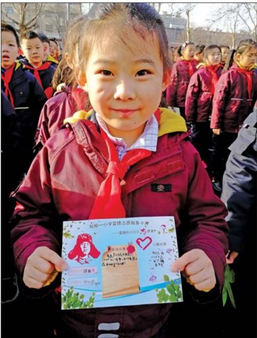
◀5日的开学典礼上,甸柳一小的小学生展示手中的学雷锋志愿服务卡。

长于冬梅和老师代表为学生送上了新年大红包,红包里面不是人民币,而是学校领导和老师对同学们的激励和心意。老师的红包中装着爱心、宽容、智慧、尊重,努力发现每一位同学身上的闪光点;校长的红包里则是今年设立的校长徽章的内容,奖励在学习、纪律、文明、文体、卫生等方面表现突出或进步明显的学生。