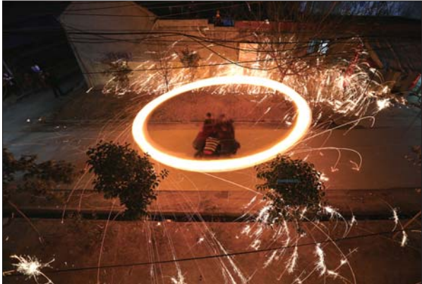
羊山镇杨早张庄揉铁花表演。