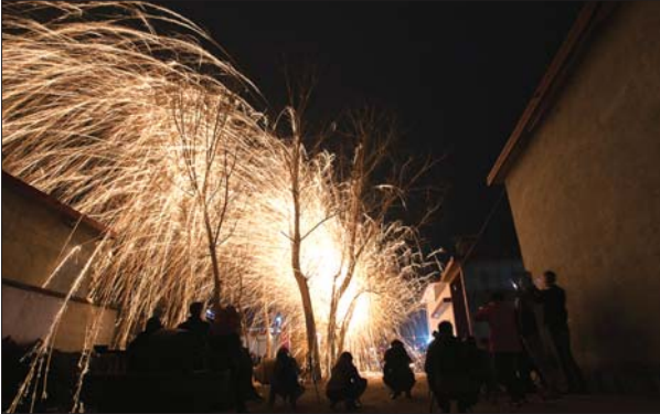
邹城大束镇葛炉山打铁花。