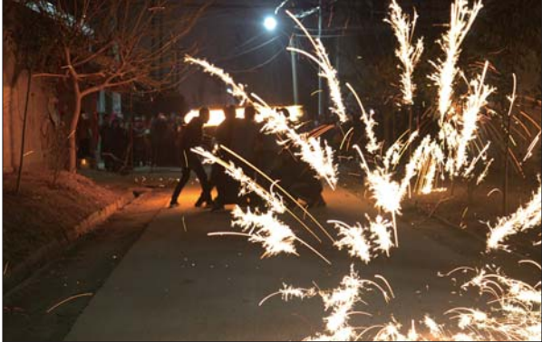
羊山镇杨早张庄揉铁花表演现场。