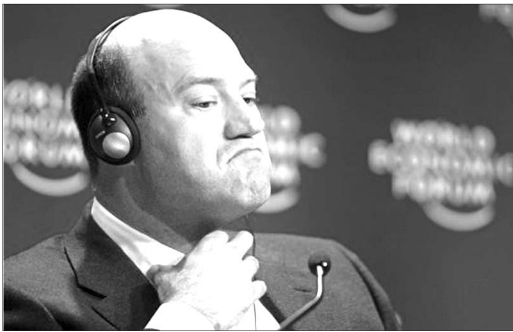
▲ 白宫国家经济委员会主任科恩

科恩来自华尔街,作为白宫首席经济顾问,他一直试图劝说总统特朗普不要提高钢铝产品进口关税,但未能让特朗普回心转意。经济分析师认为,随着科恩离开,主张贸易保护主义的一派将在白宫内部占上风。