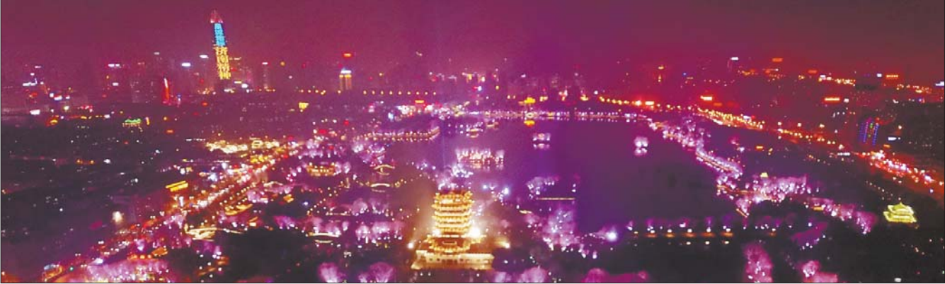
明湖秀全景图(资料片)

西安市利用黑夜搞文章跟济南几乎同步,西安现有大唐芙蓉园、大慈恩寺以及大雁塔公园每到夜间也是美轮美奂,灯火辉煌,但是这些老景点潜力有限。2017年西安把花灯会引到了曲江池,并推出了“西安年·最中国”的概念。“之前花灯会没那么漂亮过,今年曲江池的游客太多了,景区周边实行了交通管制,很多市民挤都挤不进去。”西安市民敬先生说。