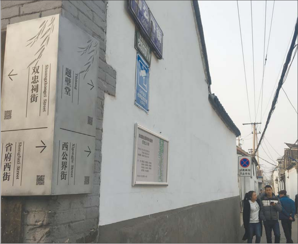
济南泉城路街道办推出了“泉巷”,扫描牌子上的二维码就能知老街巷的历史。

她是杜甫诗里的“海右此亭古,济南名士多”,她是李清照词里的“争渡争渡,惊起一滩鸥鹭”,她是辛弃疾叹道的“稻花香里说丰年,听取蛙声一片”,她是赵孟頫《鹊华秋色图》里的“云雾润蒸华不注,波涛声震大明湖”,她是老舍笔下“响晴”的冬天,她是梁容若赞的“在厚重里有潇洒,在纯朴里有灵秀,在平凡里有器用”,她还是琼瑶创造的“还记得大明湖畔的夏雨荷吗”。她是有着2600年历史的古城,她就是我们生于斯长于斯的济南。为何一座人文荟萃、名士风流的古城却在今天变成了“钝感之城”,大明湖比西湖,玄武湖差在哪里,泉城如何比肩杭州、南京、西安?今天本报将从多层面把这座城市的这座城市与这些以旅游著称的城市进行比较,找找这座千年古城如何用好现在的资源,发展属于泉城特色的全域旅游。