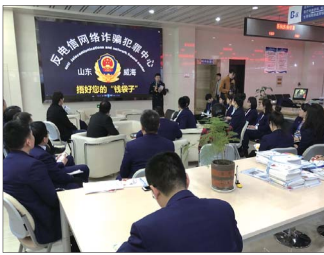
“社保沙龙”之防范电信网络诈骗专题讲座现场。

本报文登3月13日讯(通讯员 刘俊超 李宁) 许多市民曾接到这样的诈骗电话,骗子冒充社保部门,以“您的社保卡异常”、“您的社保卡在异地被盗刷”或“您的社保卡被暂停使用”等名义,要求市民通过提供个人信息或直接转账,不少人险些上当受骗。3月9日,威海市公安局文登分局的工作人员走进区社会保险服务大厅,开展“社保沙龙”之防范电信网络诈骗专题讲座,帮助社保大厅服务人员快速掌握防诈骗知识,在自身受教的同时,也便于更好地协助公安机关开展全民防诈骗宣传活动。接下来,我们就来揭穿骗子们的套路,为大家提供防范之道。