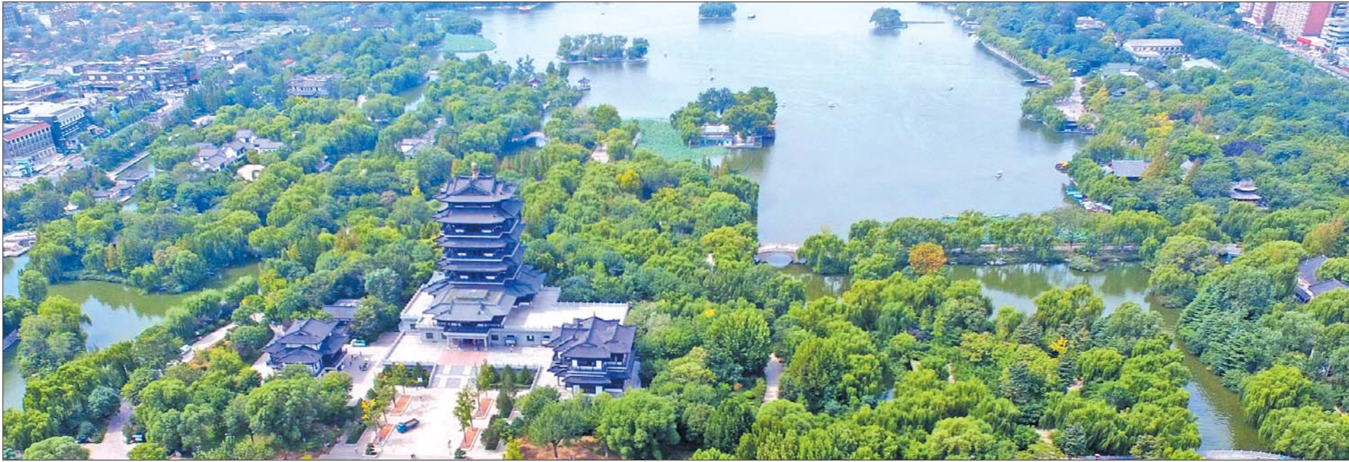
大明湖全景美醉济南。(资料片) 本报记者 周青先 摄