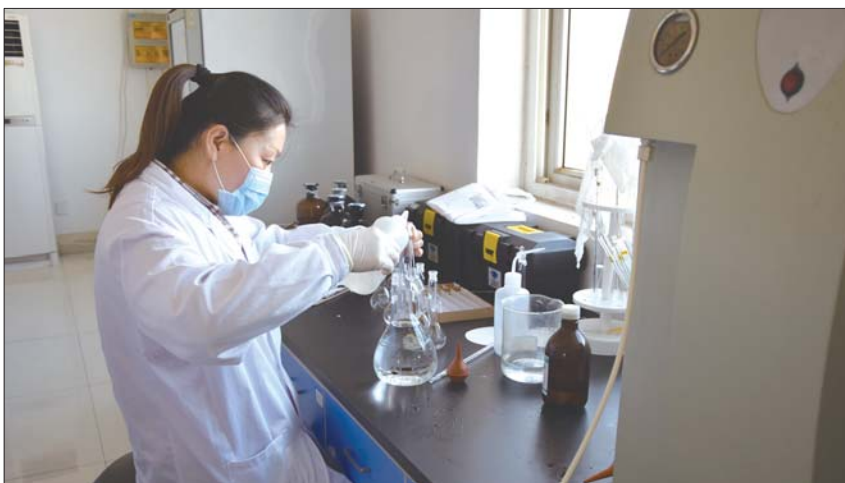
水厂工作人员正在检测水质。

公司将认真落实《济南市城乡饮用水水质改善三年行动计划(2018-2020年)》,加强业务培训,严格技术规范,着力提升水质化验检测能力。在实现三处水厂出厂水浊度、PH值、余氯(二氧化氯)在线监测的基础上,逐步实现对城区、镇(街道)总表以上等重点区域管网水的浊度、余氯的在线监测。严格按照全省城镇供水监测项目和频次,坚持水库原水和出厂水日检9项,出厂水和管网末梢水月检42项,出厂水每半年106项指标全分析,并根据检测结果,水厂及时调整水处理