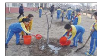
爱绿护绿在行动 近日,沂源县悦庄镇中小学校的少先队员们在辅导员带领下,给校园树木除草、松土、浇水、培土,增强爱绿护绿意识。(任相乾)

新学期,田镇义和小学各班级举办了一次赏心悦目的“我的中国年”分享会,展示同学们的各种创意成果寒假作业,福字、元宵灯笼,创意狗年吉祥物、春节对联等,激发同学们热爱优秀传统文化的热情。(刘春燕)