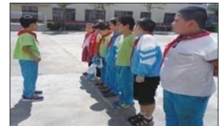
开展“一日一歌”活动 为丰富学生日常生活,增强学生的爱国主义情怀。近日,沂源县南麻街道北刘庄小学开展“一日一歌”活动。(孙庆梅)

近日,临淄二中通过校广播、讲座、主题班会等形式集中学习交通安全法规知识。教育学生文明骑车、乘车,正确识别交通标志牌、信号灯,告诫学生要珍爱生命,遵守交通法规,做一个遵纪守法的小公民。(郑军)