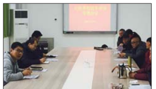
召开校车安全管理会 为保障乘坐校车学生人身安全,张店区大张学校开学即召开安全管理专题会。全体校车驾驶员和随车照管员参加。(国旭)