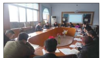
召开安全工作培训会 近日,沂源县鲁村镇教体办召开全镇安全工作一岗双责失职追责培训会,全镇学校校长、分管校长、安全主任参会。(唐传音)

日前,黑里寨学区开展学雷锋活动。加强宣传引导,引导学生了解雷锋事迹,宣传雷锋精神;注重实践引领,组织广大学生走出校园,走进社区,走向社会,开展学雷锋实践活动,以实际行动争做雷锋传人。(周强)