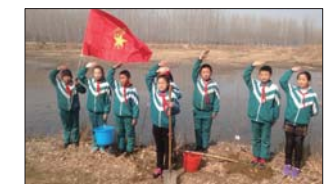
开展植绿护绿活动 为增强同学们的环保意识,为美丽家乡增添一抹新绿,植树节之际,沂源县鲁村镇中心小学开展了植绿护绿系列活动。(穆乃刚)

近日,皇城二中组织召开全体教职工学习工作会议。认真传达学习了2018年全区教育工作内容精神,并结合学校教育实际,对2018年全校教育工作进行了全面部署,做了具体要求。(耿万辉)