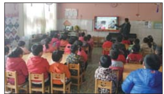
资助育人教育活动 近日,沂源县荆山路幼儿园开展了资助育人教育班会活动。全面做好家庭经济困难幼儿资助工作,完善资助育人工作模式。(夏巧凤)

为进一步贯彻落实新学期学校的工作目标与思路,部署各项工作,确保学校各项工作顺利开展,近日,傅家实验小学召开了新学期教育教学工作会议,激发了全体教师的工作热情。(王超)