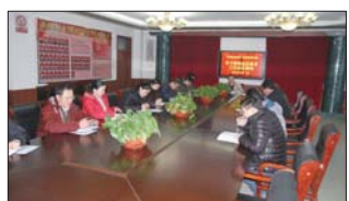
传达局会议工作会议精神 张店区教育局工作会议召开后,近日,铝城一中迅速召开中层干部会议传达全区教育工作会议精神,谋划新学期工作。(王立水)