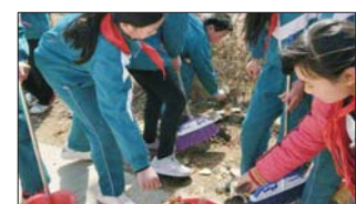
开展学雷锋活动 结合“3·5学雷锋纪念日”,沂源县张家坡镇冯家圈小学师生组织开展了“清理白色垃圾,还民清洁空间”活动。(王耀敏 周琴)