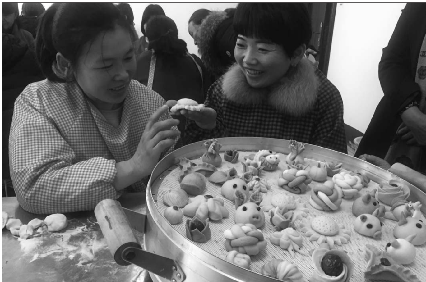
面点培训班的学员正在交流经验。

从2018年开始到2020年,济宁市人社局将利用三年时间,统筹各类职业技能培训资源,建立面向城乡劳动者的职业技能培训体系。期间,将完善技能劳动者从初级工、中级工、高级工到技师和高级技师的成长通道,壮大知识型、技能型、创新型劳动者队伍。为促进解决济宁市结构性就业矛盾、服务新旧动能转换提供技能人才支撑。