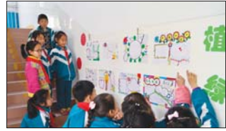
南鲁山镇中心小学举行“植绿护水”活动。(陈新宝)