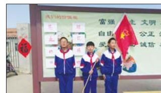
沂源县三岔中心学校学生宣传“文明过节,禁放烟花爆竹”。(元和田)