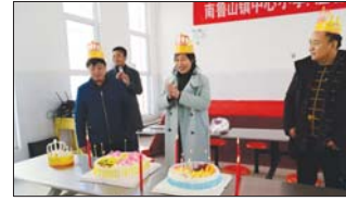
南鲁山镇中心小学开展“温馨时刻 激励我成长”活动。(刘艳艳)