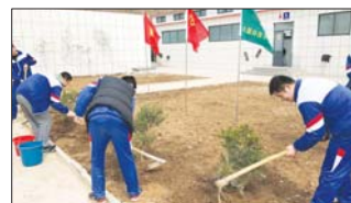
沂源县三岔中心学校的青年团员开展绿化校园活动。(元和田)