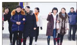
南鲁山镇中心小学定期开展“快乐日”活动。(刘艳艳)