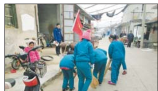
沂源县三岔中心学校开展“美丽村庄街道”行动,培养学生品质。(元和田)