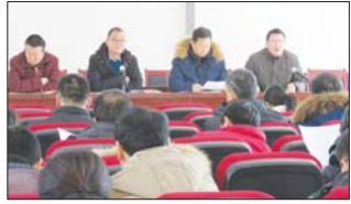
沂源县三岔中心学校党小组召开期末民主生活会。(元和田)