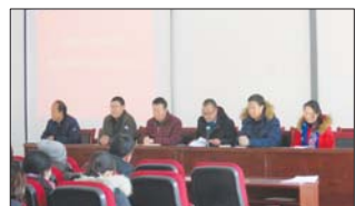
沂源县三岔中心学校召开教职工代表第九届二次全会。(元和田)