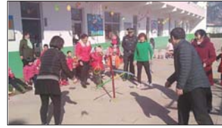
南鲁山镇中心幼儿园开展多彩活动庆祝妇女节。(唐爱君 陈作敏)