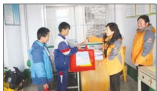
中国麦田计划山东分社人员来到土门中学送温暖。(陈新宝 祝金刚)