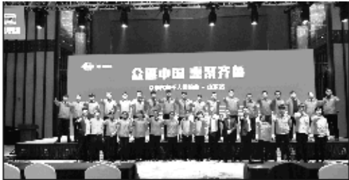
众惠中国,惠聚齐鲁 3月18日众泰汽车千人团购会山东站威海站启。(孙海)