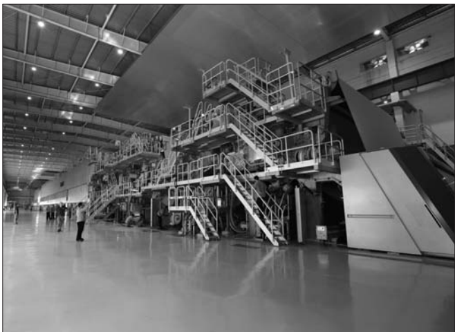
PM29:2015年9月投产,是世界最先进的胶版纸生产线。

业拥有290多项有效发明专利,填补国内空白10余项,国家科技进步奖1项,国家技术发明奖1项,国家重点新产品2个,承担国家863计划项目1个,国家、省部级科研课题10余项,山东省技术发明奖1项,山东省科技进步奖6项。