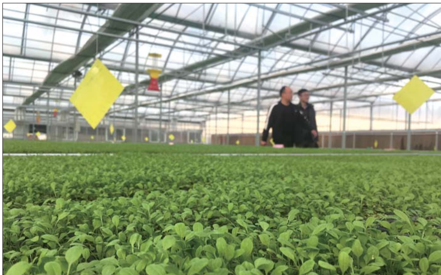
“种植+加工+仓储”,嘉祥打造全市首个一二三产业融合示范点。

引导企业树立“互联网+”思维,创新市场营销模式,注重细分市场产品的创新,产品质量提升和品牌培育,加速信息化和工业化融合。爱克森服