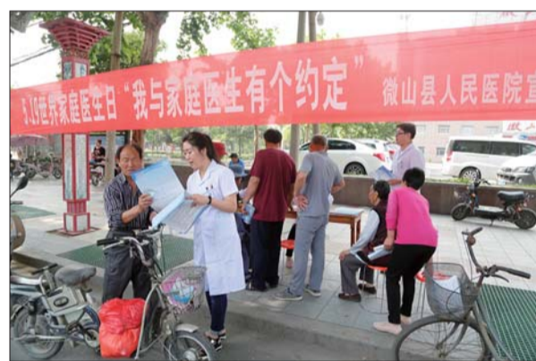
世界家庭医生日义诊。

量血压、测血糖、看眼疾、查听力……微山县家庭医生服务团队为居民制定个性化签约服务包,定期上门提供医疗服务,与居民密切联系,有问题随时咨询家庭医生,努力让微山县居民“大病不出县,小病不出乡,慢病在村居”,让人民群众切实体会到国家关爱的同时也密切了家庭医生和签约群众的关系。