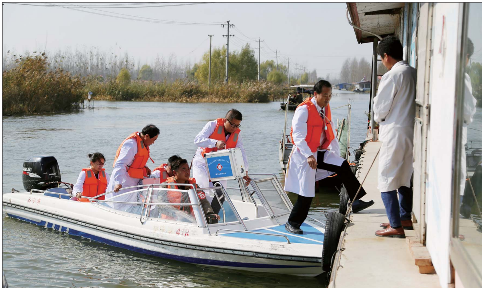
家庭医生小组走村入户。