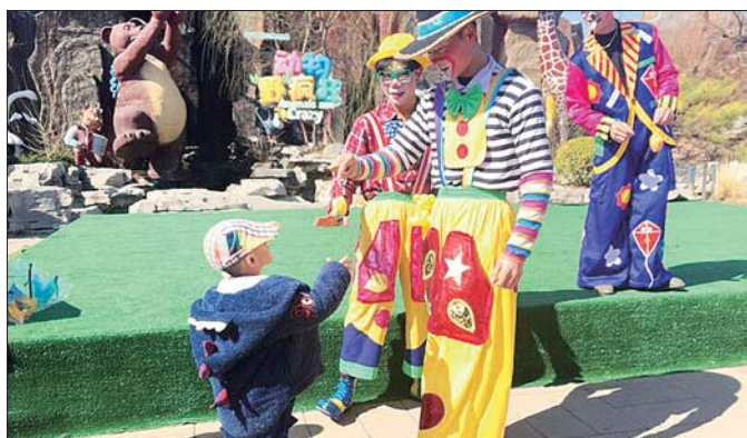
小丑先生派发礼物。

界,学习更多的动植物科普知识和欣赏精彩的马戏表演,济南野生动物世界特在春暖花开之际推出一系列春季游园优惠政策。其中,“家庭春游优惠”为两大一小家庭出游提供福利,即两位成人购买两张160元全