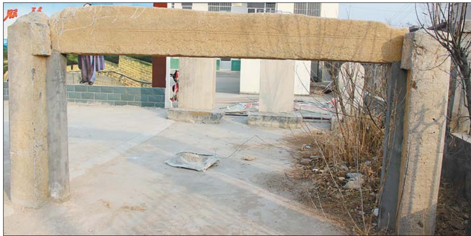
唐李村古文物陈列园卢故城石门。

一块是“光绪十七年”即1891年立的“重修观音堂碑记”碑,距今127年。碑文是由村里的复设教谕任申科恩贡生国绥