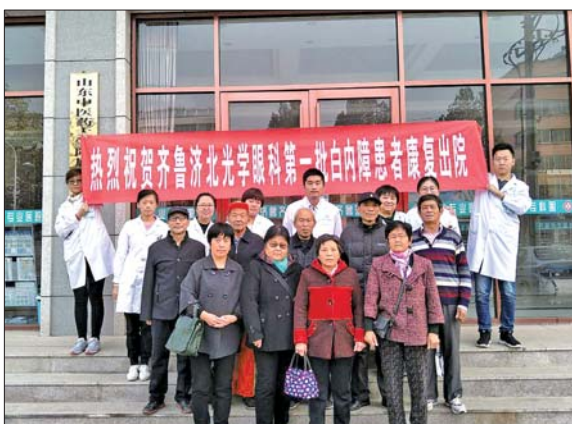
第一批白内障患者康复出院。