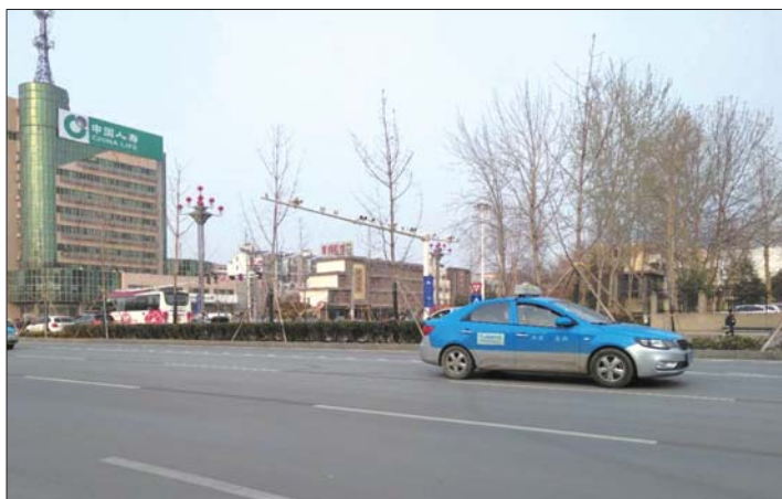
出租车公司一个通知激起“千层浪”。

杨经理说,出资设立打击“黑车”专项奖励基金,是菏泽市十六家出租车公司协商一致做出的决定。“受多方面因素影响,出租车行业受到巨大冲击。”杨经理说,出租车司机将