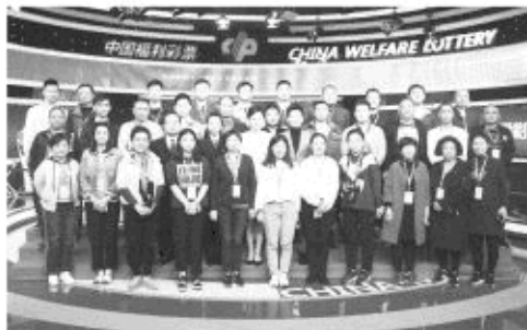
山东观摩团摇奖现场合影

动辄产生百万、千万乃至亿元大奖,双色球摇奖大厅堪称中国彩民向往之的“梦工厂”。2005年4月12日,中福彩中心开创全国性电脑票摇奖现场广泛接待公众的先例,启动了“走近双色球”活动,组织