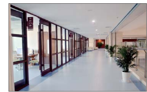
凤林院区门诊诊区。