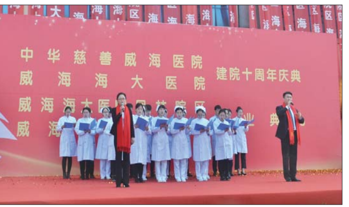
工作人员合唱院歌《医者父母心》。