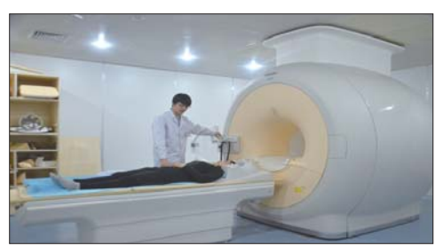
飞利浦Achieva 1.5T超导核磁共振。