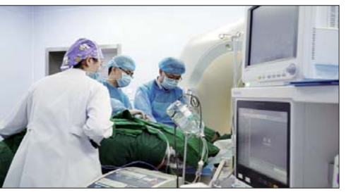
肿瘤微波消融手术。