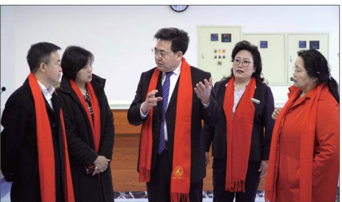
领导们参观护理院。