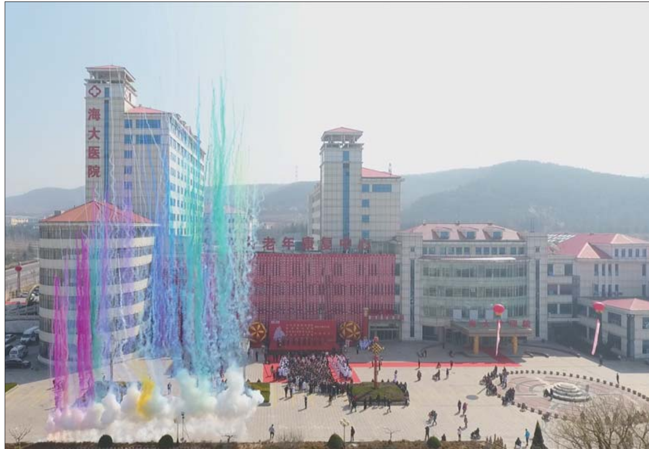
海大医院凤林院区、海大护理院。

十年发展硕果累累,与之相衬的荣誉亦纷至沓来。海大医院先后被授予“山东省医疗质量万里行”民营医院第