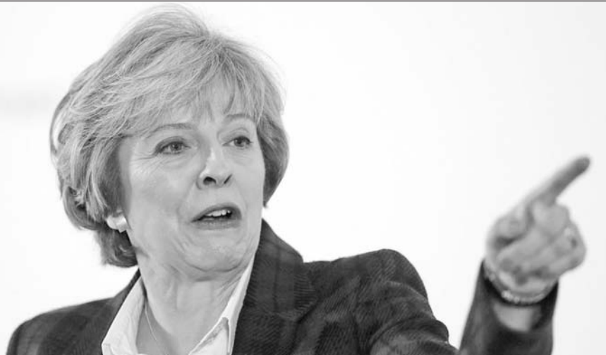
英国首相特雷莎·梅

前俄罗斯情报人员斯克里帕尔和女儿尤利娅在英国“中毒”事件引发的外交风波持续发酵。26日,16个欧盟成员国及美国、加拿大、阿尔巴尼亚、挪威、马其顿、乌克兰、澳大利亚等国宣布驱逐俄外交人员。俄方则抨击这些国家串通反俄,并表示将采取对等措施予以回应。