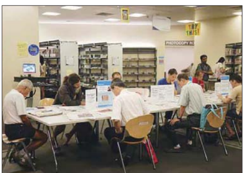
新加坡开在闹市区的图书馆吸引了很多读书人