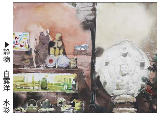
▲静物 白露洋 水彩