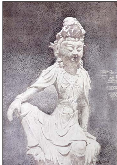
▲佛像 39×54cm 毕敬虎 水彩