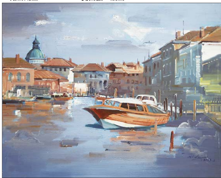
▲欧洲之行 50×60cm 刘雷 油画