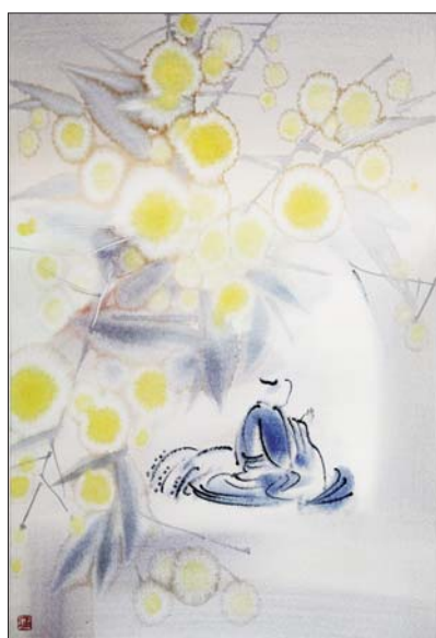
▲静观 39×54cm 王涌 水彩