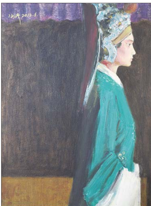
▲戏曲人物 60×80cm 岳海涛 油画

青未了画廊地址:济南市马鞍山路2-1号山东大厦大堂 鉴藏热线:15966685196、15853198656