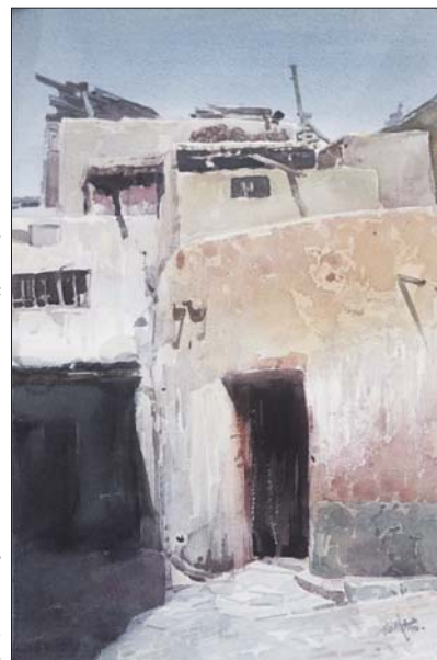
▲喀什古巷之一 39×54cm 王诚浩 水彩