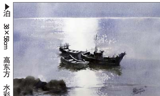
▲泊 38×38cm 高东方 水彩