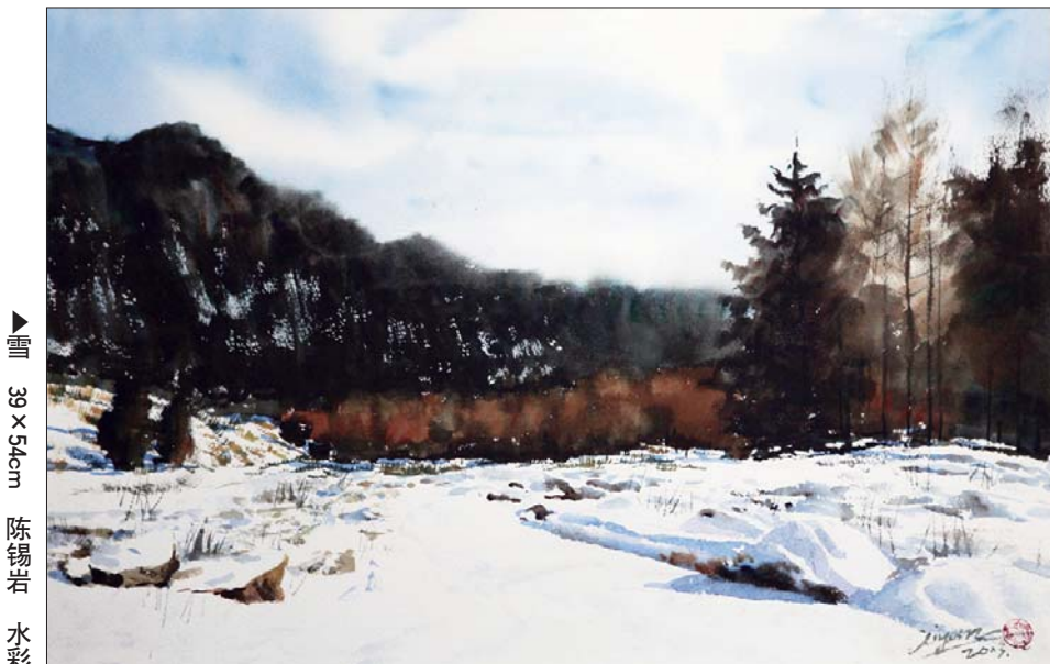
▲雪 39×54cm 陈锡岩 水彩