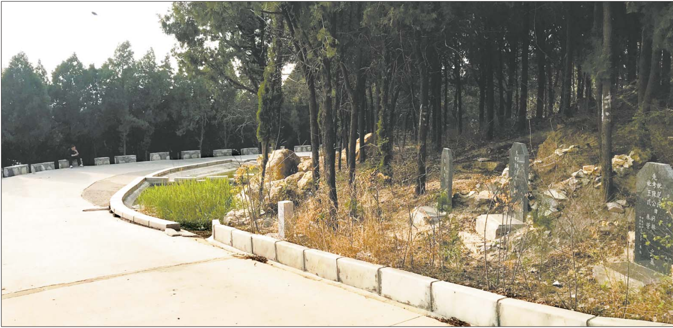
燕子山环山路旁私坟,市民散步随时可见。

那么如何让人们不再在山体公园上建坟?记者了解到,目前主要有修建公益性公墓和骨灰堂两种方式,在这方面章丘区和济阳县做得相对较好。 章丘区现有公益性公墓38