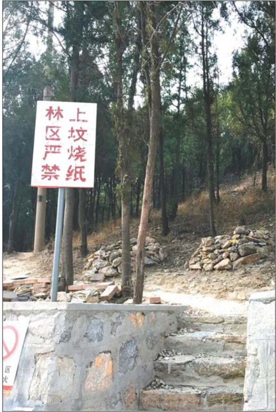
为防清明祭奠引发山火,林场已在燕子山上立起警示牌。

近日,记者通过连续走访发现,济南的多数山体公园都建有私坟,给上山游玩的市民造成了不小的视觉干扰。针对山体公园上的私坟,相关部门表示坚决杜绝新坟再建,但要把存量坟迁走并非易事,需要林业、民政、园林、国土等多个部门联合整治。专家呼吁尽快出台管理办法,让济南山体公园更美。