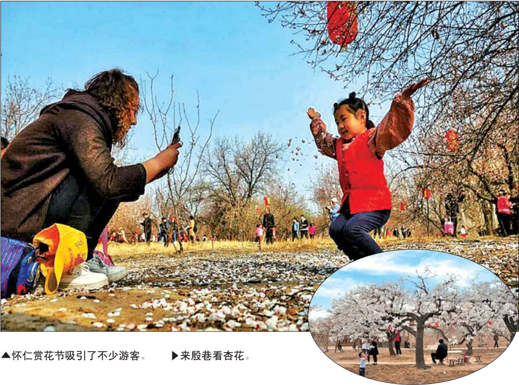
▲怀仁赏花节吸引了不少游客。