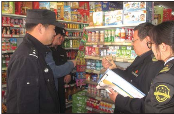
崔寨食药所开展食品经营风险隐患排查行动。

本报4月5日讯(通讯员 王宝磊 孙颖慧 记者 刘慧) 近日,为进一步强化食品经营安全监管,督促食品经营单位自觉履行主体责任,有效防控食品安全风险,济阳县崔寨食药监管所联合崔寨街道食品安全办公室、市场监管所和派出所开展了食品经营风险隐患排查联合排查行动。