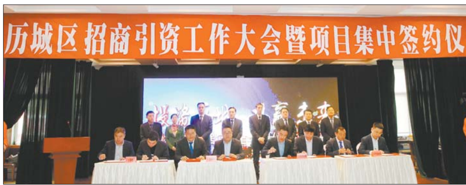
历城区招商引资工作大会暨项目集中签约仪式现场。