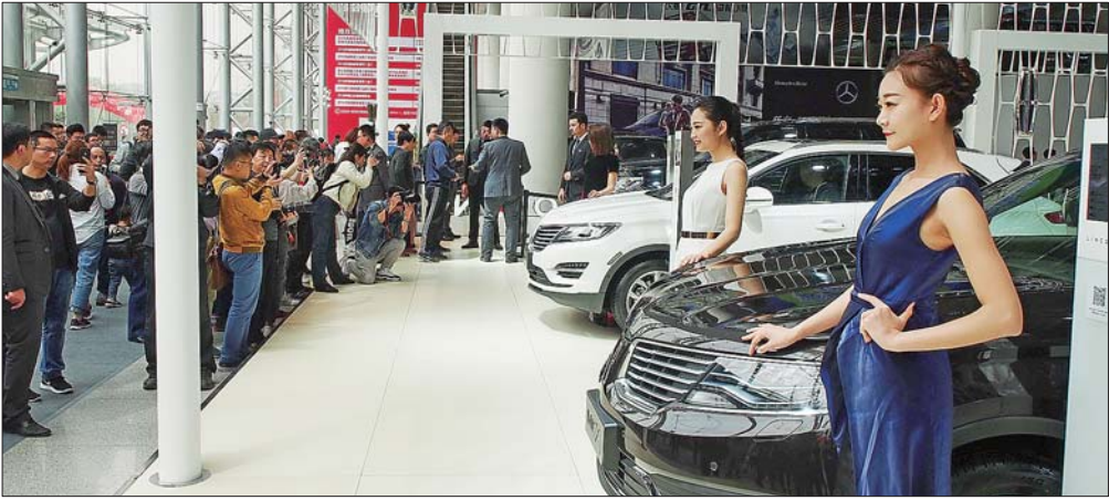
齐鲁车展开幕首日异常火爆。

此外,一站式、多业态联动的服务模式也是本届车展的一大亮点,银行、房展、汽车后市场、零售等多行业为车友提供多方位服务。同时,为了方便市民办理相关业务,济南市交警支队高新大队交通管理服务站的移动车管所也在高新展馆外,为前来观展的车主和“准车主”们提供违章处理和年检合格证的发放服务。