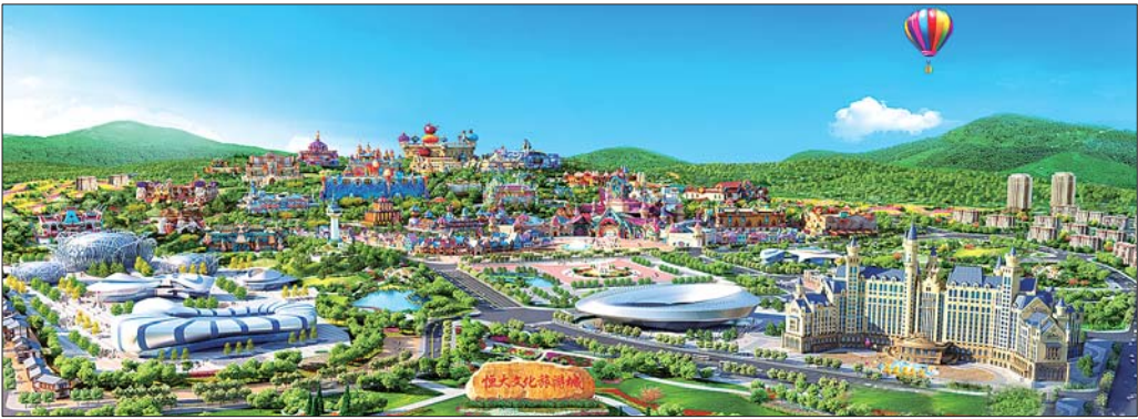
贵阳恒大文化旅游城

近日,备受瞩目的贵阳恒大文化旅游城在央视等全国各大主流媒体亮相,迅速引发社会各界广泛关注。据介绍,贵阳恒大文化旅游城由世界500强企业恒大集团旗下的恒大旅游集团倾力打造,坐拥恒大童世界、恒大养生谷、恒大足球世界、恒大温泉小镇等产业配套集群,将成为全球规模最大、档次最高、配套最全的世界级文化旅游胜地。