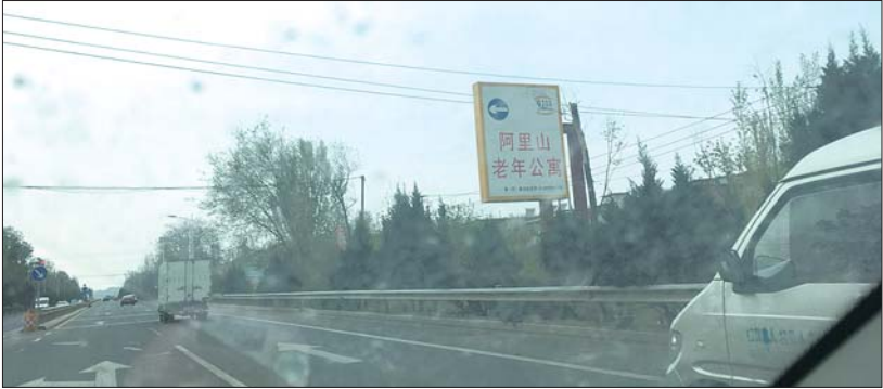
通往南部山区的省道103旁，不时能看到老年公寓的指示牌。

套不如市区，一旦老人出现了急症重症，家属都希望能往市区的大医院送。但是救护车从市区来到这里需要半个多小时，再送到医院又得近40分钟，来回一折腾可能就会耽误治疗。”孙毅每次都要先跟家属说明白其中的利害，由他们选择，养老院附近有社区诊所，但这还不够。