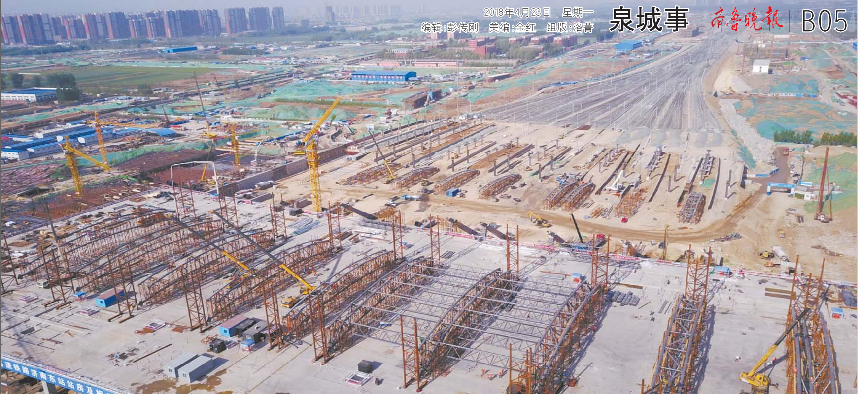
4月20日,济南新东站工地航拍全景。站房的二层平台已经完工,站房框架已基本成型。